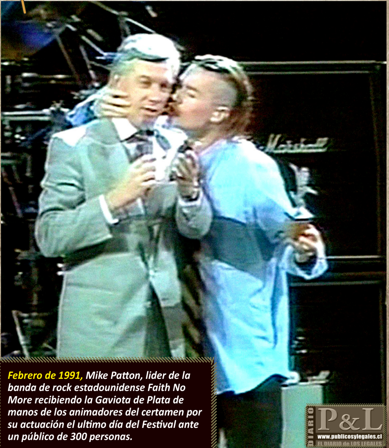
Febrero de 1991 , Mike Patton, líder de la banda de rock estadounidense Faith No More recibiendo la Gaviota de Plata de manos de los animadores del certamen por su actuación el último día del Festival ante un público de 300 personas.